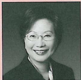
邱霜梅博士，MBE，JP 職業訓練局執行幹事

教育及培訓目的是要學員能學以致用。在「資歷架構」下，行業制訂主要工種的「能力標準說明」，而培訓機構就根據這些標準設計課程，以能力為本。這樣從業員便能好好掌握他們必須具備的能力及達到的成效，更充分地應付工作上的需要，支援行業發展。